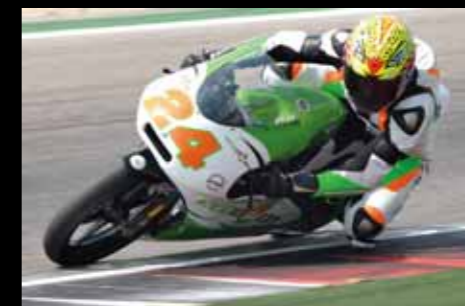
> Elia Cunti terzo per 4 millesimi.