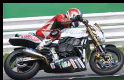
> HORNET CUP: Lorenzo Segoni, a punteggio pieno in classifica.