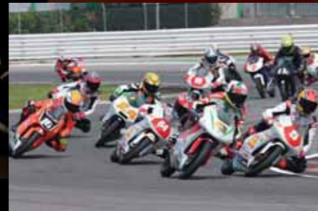
> Stirpe (63) in lotta con Faccani (5) e Caricasulo (64).