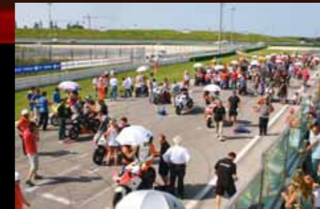
> Le CBR al via. Ben 48 i piloti presenti.