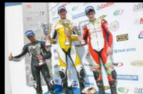
> CBR600RR CUP: Sassari, Magnanelli, Lagiongada.